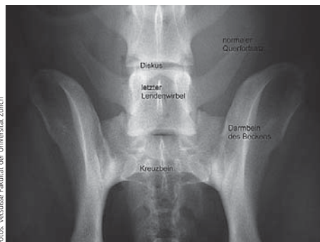
Abb. 1: Normale Anatomie am Kreuz-Lenden-Übergang. Der Hund liegt in Rückenlage. Der letzte Lendenwirbel trägt beidseits normal geformte Querfortsätze, das Kreuzbein besteht aus 3 verwachsenen Wirbeln.

Was haben unsere Untersuchungen ergeben? Von den 4000 untersuchten Hunde wiesen 138 oder rund 3,5% einen Schaltwirbel auf. Gehäuft waren Schaltwirbel beim Deutschen Schäferhund und beim Grossen Schweizer Sennenhund zu finden. Extrem häufig kam die Veränderung