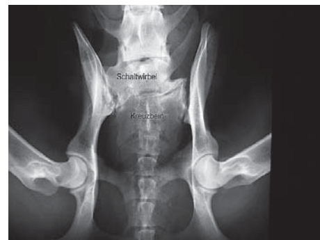
Abbildung 2: Zwischen Lendenwirbelsäule (oben) und Kreuzbein liegt ein Schaltwirbel. Er zeigt nur rechts im Bild einen normalen Querfortsatz, auf der linken Seite ist dieser mit dem Becken verwachsen. Die Verbindung zum Becken ist sehr asymmetrisch ausgebildet.